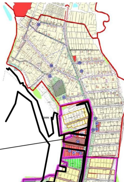
СХЕМА РАСПОЛОЖЕНИЯ ОБРАЗУЕМОГО ЗЕМЕЛЬНОГО УЧАСТКА НА ГЕНЕРАЛЬНОМ ПЛАНЕ